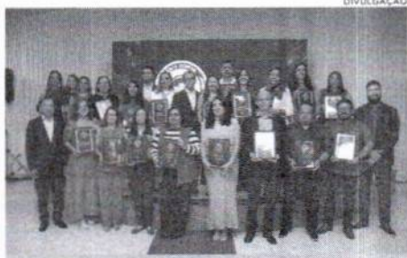
Vinte empresas em Caxias foram premiadas com o Selo Sebrae de Qualidade Empresarial 2025

futuro para os pequenos negócios, que são a base da economia do Maranhão”, destacou.